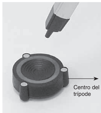
Figura 2a. Coloque la almohadilla debajo de la pata del trípode con uno de los "pies" apuntando al centro del trípode.

Proporcionando excepcionales productos ópticos desde 1975