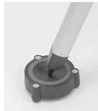
Figura 2b. Asegúrese de que las patas del trípode se apoyan sobre el centro exacto de la almohadilla.

viscoelástico y se convierte en una pequeña cantidad de calor, en lugar de reflejarse en el suelo y llegar a la pata del trípode. Si se produce una perturbación en el suelo cerca del telescopio, las vibraciones ni siquiera llegan a la pata del trípode. El resultado es una reducción significativa de la duración de las vibraciones.